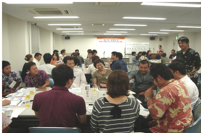
熊本氏を囲んでのグループディスカッション