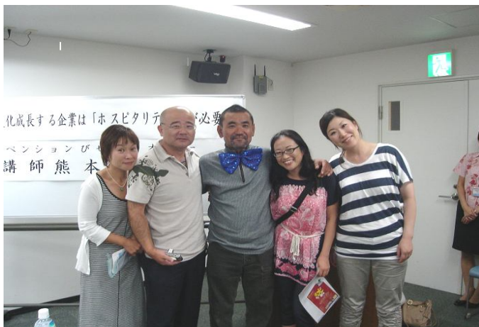
熊さんを囲んで 東京、仙台からかけつけたお客様。